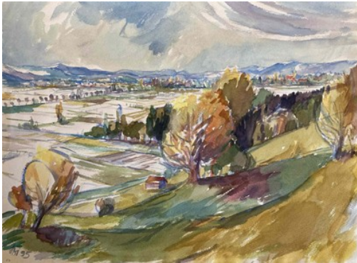
Erwin Birnmeyer Herbstlandschaft (Kirchweihtal), 1995