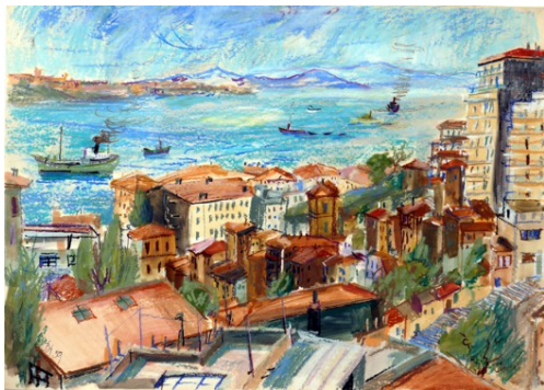
Erwin Birnmeyer Stadtansicht (Istanbul), 1959