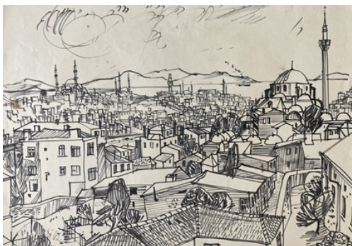
Erwin Birnmeyer Istanbul von Yedikule aus, 1962