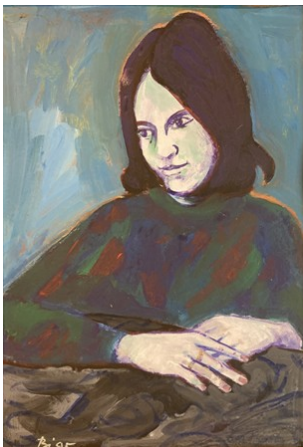
Erwin Birnmeyer Eva Hesse, 1995