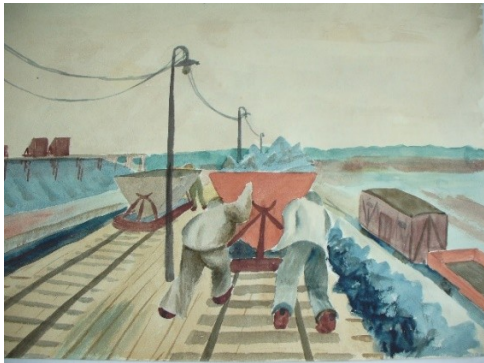
Erwin Birnmeyer Gefangene im Steinbruch mit Lore, 1946

ERWIN BIRNMEYER | Künstler und Kunstpädagoge 27.02.2025–06.04.2025