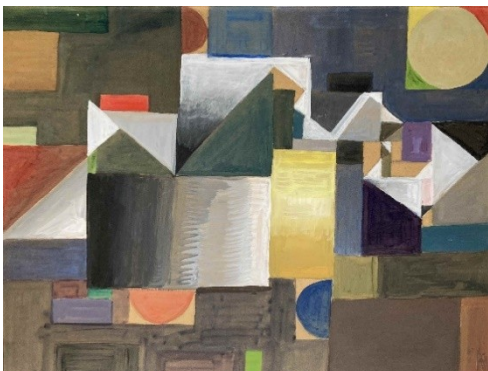
Erwin Birnmeyer Ohne Titel, nach 2000