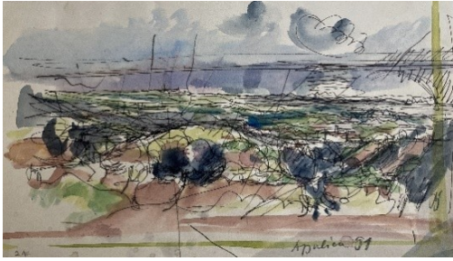
Erwin Birnmeyer Apulien, 1991