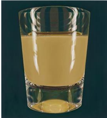
René Wirths Apple Juice, LIQUIDS#5, 2018/19