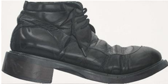
René Wirths Stiefel, 2008