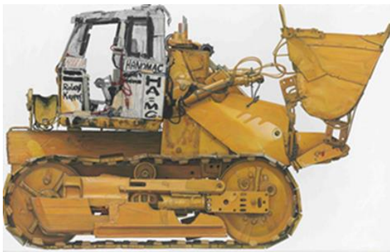
René Wirths Bagger, 2010