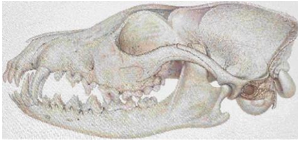
René Wirths Fuchsschädel, 2017