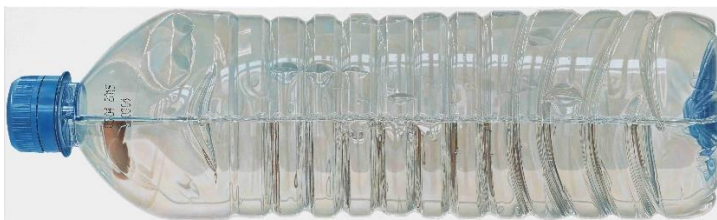
René Wirths Wasserflasche, 2014

Privatsammlung