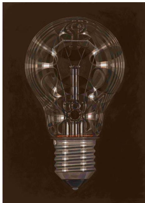
René Wirths, Bulb, 2020, Öl auf Leinwand, 140 x 100 cm, Galerie Michael Haas, Berlin

Drühl wie auch Wirths sparen scheinbar den Menschen aus ihrer Bildwelt aus. Doch gerade dadurch kommt der Mensch – gewissermaßen durch die Hintertür – thematisch wieder in den Blick. Die profanen Gegenstände, die Wirths malerisch übersetzt, sind allesamt vom Menschen gemacht; häufig deuten ihre Spuren eine Erzählung über die Nutzungsgeschichte der ‚portraitierten‘ Dinge an. Bisweilen tritt sogar der Künstler selbst in den gemalten Reflexionen auf den Objektflächen in das Bild, wird Teil desselben. In den menschenleeren Landschaften und düsteren Seestücken Sven Drühls dagegen schwingt neben einer häufig dystopischen Stimmung immer auch der Aspekt der Naturzerstörung durch den Menschen mit. Beide Positionen verbindet zudem das serielle Moment. Im Œuvre von René Wirths gibt es zahlreiche wiederkehrende Bildmotive, z.B. Gläser, Schädel oder Feuerzeuge. Und auch im Werk Drühls kommen viele Motive bzw. Motivfragmente und Umkehrungen über Jahre hinweg immer wieder in Variationen und Neuinterpretationen zum Einsatz. Beide Künstler leben und arbeiten in Berlin.