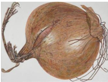
René Wirths Zwiebel, 2017