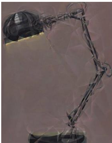
René Wirths Lamp, 2022

Privatsammlung, Courtesy of Galerie Michael Haas, Berlin