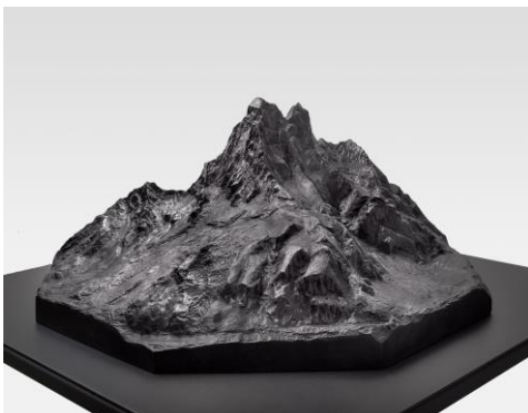
Sven Drühl Shivling Eroded, 2021