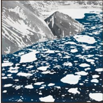
Sven Drühl S.D.N.N. III, 2017