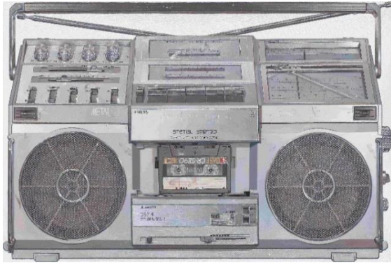
René Wirths Ghettoblaster, 2017