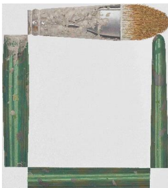
René Wirths Pinsel, 2015