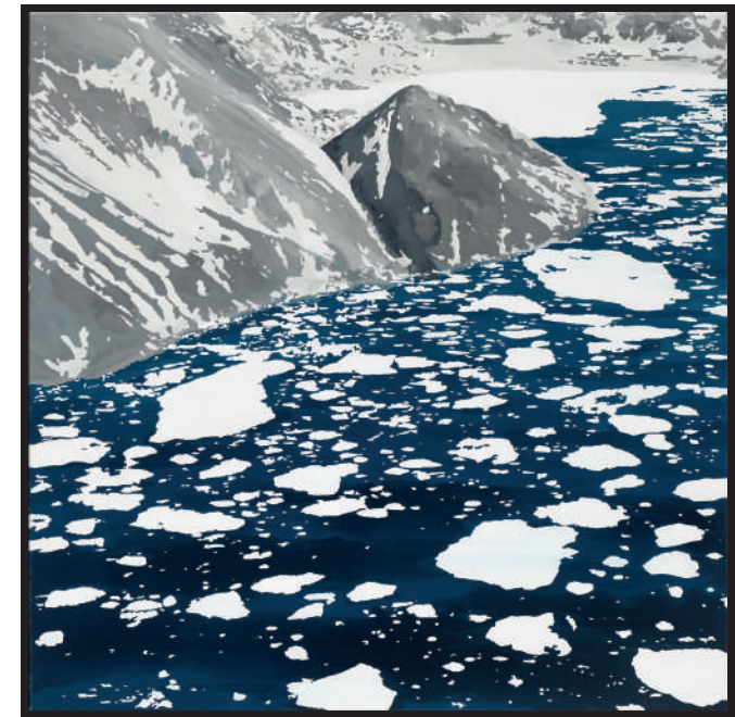
Sven Drühl, S.D.N.N. III, 2017, Lack auf Leinwand, 110 x 110 cm, Privatsammlung, Berlin

Zusätzliche Führungen sind auf Anfrage buchbar. Buchung und Infos unter 08341 8644 oder mail@kunsthaus-kaufbeuren.de