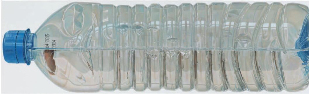
René Wirths, Wasserflasche, 2014, Öl auf Leinwand, 90 x 300 cm, Galerie Michael Haas, Berlin

Beiden künstlerischen Ansätzen ist jedoch auch noch anderes gemein, daher die Wahl der Gegenüberstellung in einer