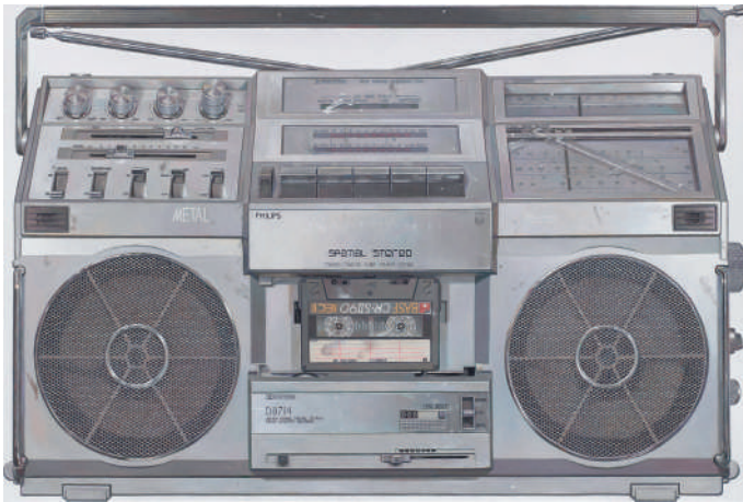
René Wirths, GhettoBlaster, 2017, Öl auf Leinwand, 180 x 270 cm, Galerie Michael Haas, Berlin