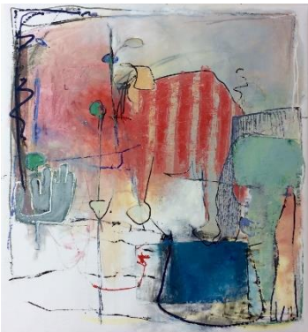
Sigrid W. Mathews, Ohne Titel , 2017 Öl auf Leinwand, 130 x 140 cm