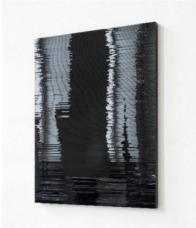
Julia Schewalie, Stripes #2 , 2013 Acrylglas, Holz 50 x 40 cm © J. Schewalie