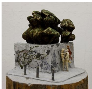
Philipp Liehr, Halle Nightlife , 2016 Fichte, Acryl, Gips, 40 x 30 x 35 cm