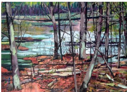
Theresa Möller, Unterschichten , 2017 Acryl und Öl auf Leinwand, 80x110 cm © T. Möller