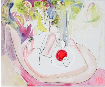
Sophie Schmidt, Atelierinterieur mit Bauchigung in Maastricht 2 , 2017 Aquarell, Tinte und Ei auf Leinwand, 100 x 120 cm © S. Schmidt