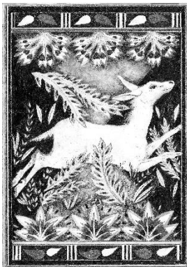
Ricarda Hoop, Reise in meinem Zimmer – papier peint (Bildtapete) , 2016 Bleistift auf Papier, 20 x 30 cm