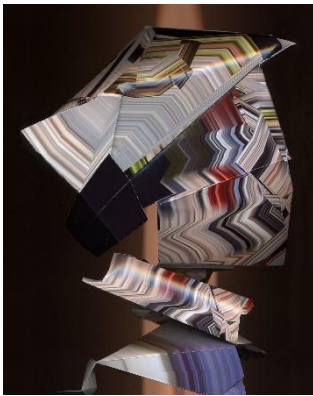
Kathrin Ganser, Faltungen (Gyrosensor models) , 2018 Lambda Print, 50 x 40 x 3 cm © VG Bild-Kunst Bonn 2018