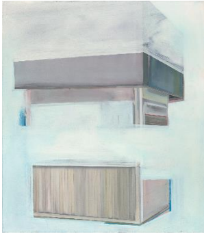
Birte Horn, teile_2 , 2015 Öl auf Leinwand, 80 x 70 cm © VG Bild-Kunst Bonn 2018