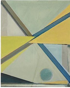
Raik Gupin, Ohne Titel , 2017 Öl, Papier, Wachs, Harz, Gesso auf Holz, 50,5 x 40,5 cm © R. Gupin