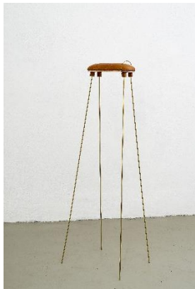
Judith Egger, Streckbock , 2015 Ziegenleder, Messing, Balsaholz, 104 x 30 x 25 cm