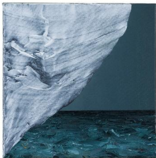
David Borgmann, Ohne Titel (ST 42) , 2018 Öl auf Leinwand, 30 x 30 cm © D. Borgmann