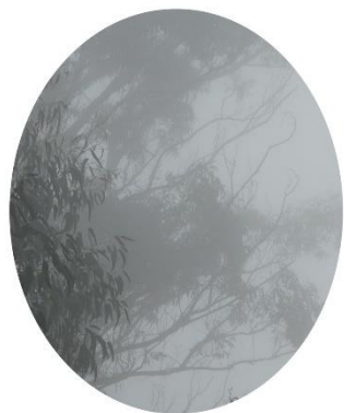
Karen Irmer, Bright (Edition: Mirrors) , 2016 Fotografie, 19 x 24 cm