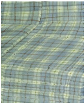
Jonah Gebka, Muster #1 , 2017 Aquarell auf Papier, 36 x 30 cm © J. Gebka