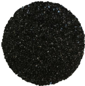
Theo Hofmann, round up , 2018 Wandrelief, Anthrazitkohle, geklebt, Ø 100 cm © T. Hofmann