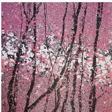
Anett Münnich, Landstück 2 , 2018 Mehrfarbensiebdruck, 32 x 32 cm © A. Münnich