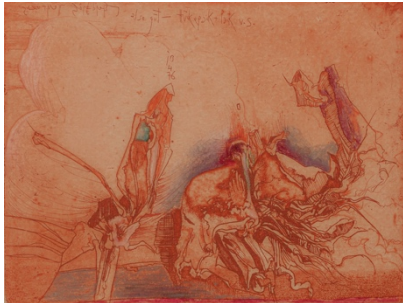
Horst Janssen O.T. (Blüten) , 1976

Kupferstich, Radierung, Buntstift auf Papier, 18 x 23,9 cm