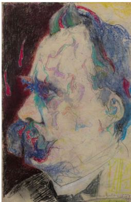
Horst Janssen O.T. (Portrait Nietzsche), 1982