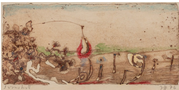
Horst Janssen O.T. ( Landschaft ), 1976