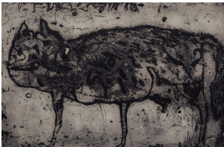
Horst Janssen O.T. ( Katze ), 1959