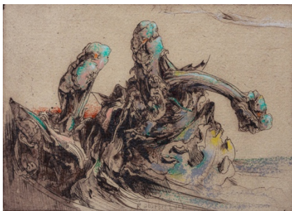
Horst Janssen O.T. ( Rabarber, Blätter ), 1976