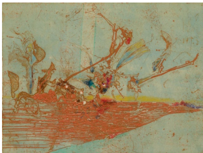
Horst Janssen O.T. (Vogel) , 1976