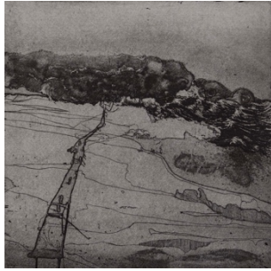
Horst Janssen O.T. ( Watt, Meer ), 1971/73

Courtesy Stadtmuseum Kaufbeuren, Sammlung Horst Janssen © VG Bild-Kunst, Bonn 2021