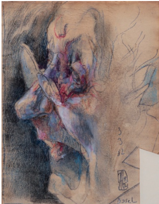
Horst Janssen O.T. (Selbstportrait), 1982

Courtesy Stadtmuseum Kaufbeuren, Sammlung Horst Janssen © VG Bild-Kunst, Bonn 2021