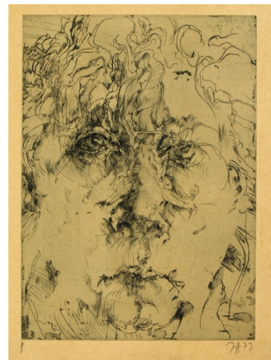
Horst Janssen, O.T. (Selbstportrait), 1973

In einer Ausstellung mit über 150 Werken zeigt das Kunsthaus in seinem Jubiläumsjahr unter dem Motto „Vom Werden und Vergehen“ ausgewählte Schätze aus der städtischen Horst Janssen-Sammlung. – Janssen, der Lebemensch und Exzentriker, gilt als einer der herausragendsten und produktivsten Zeichner und Grafiker des 20. Jahrhunderts und wurde vielfach mit Preisen ausgezeichnet. Durch seine Teilnahme an der Biennale in Venedig 1968 sowie an der Documenta 6 im Jahre 1977 in Kassel wurde Janssens Schaffen einem internationalen Publikum bekannt. Neben seinem geschärften Blick für Details und kompositorische Zusammenhänge ist es vor allem Janssens ebenso klare wie derbe und exzentrische Linienführung, die seinen Werken ihren charakteristischen Ausdruck verleiht. Janssens Themenvielfalt ist gewaltig. So entstanden neben über 1.000 Selbstportraits zahlreiche in Janssens unverwechselbarem Zeichenstil ausgeführte Darstellungen von Landschaften, Figuren und Stillleben. Stets diente ihm die Natur in all ihren Erscheinungsformen als unerschöpfliche Quelle der Inspiration. Dabei stehen immer wieder Motive der Vergänglichkeit, des Todes und Verfalls, aber auch des Lebens und seiner unbändigen Erneuerungskräfte im Mittelpunkt von Janssens Werken.