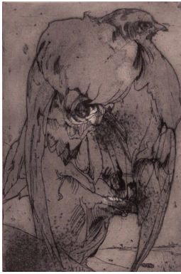
Horst Janssen O.T. (Selbst mit Vogel), 1973