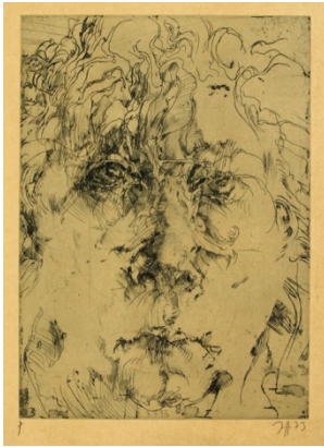
Horst Janssen O.T. ( Selbstportrait ), 1973