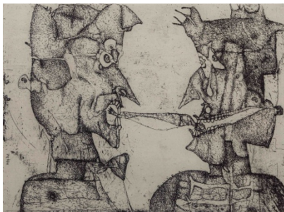
Horst Janssen O.T. (Klee und Ensor um einen Bückling streitend) , 1961