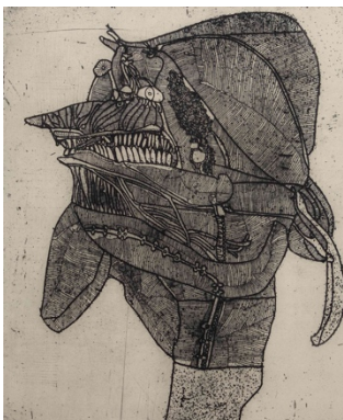
Horst Janssen O.T. (Elvira), 1958/64