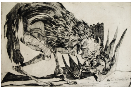
Horst Janssen O.T. (Konventioneller Fall, Vogel) , 1970