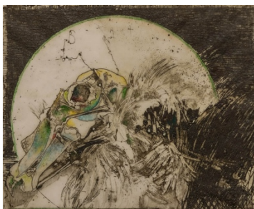
Horst Janssen O.T. ( Vogelskelett ), 1976